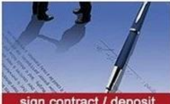
sign contract / deposit