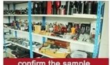
confirm the sample