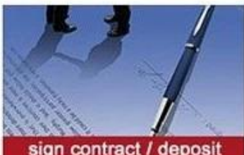
sign contract / deposit