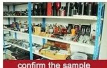
confirm the sample