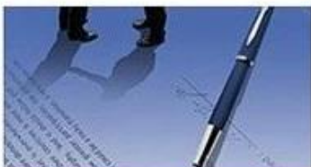
sign contract / deposit