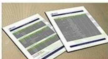
receive our quotation