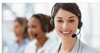
send us inquiry