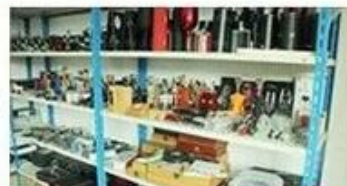
confirm the sample