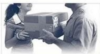
balance / delivery