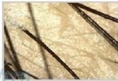
Skin & Hair