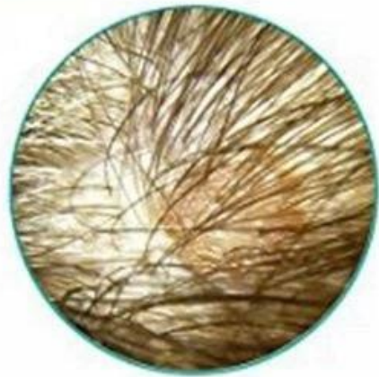
Hair quality check