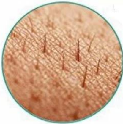
Hair follicles to check