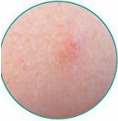
Check the Skin