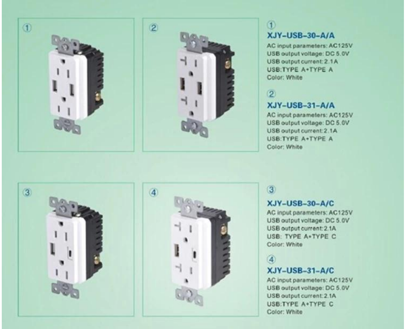
شاحن منفذ الجدار USB