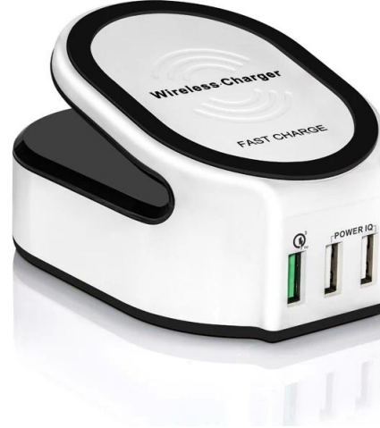
Wireless Charger Support brand: Samsung, Nokia, HTC, Google, LG, Sony, Moto