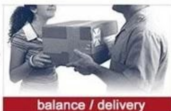
balance / delivery