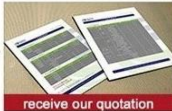
receive our quotation