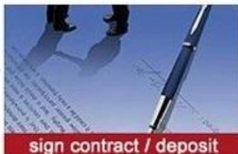
sign contract / deposit