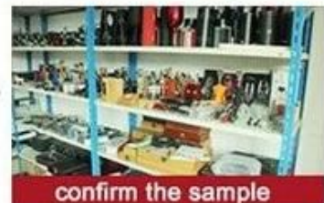
confirm the sample