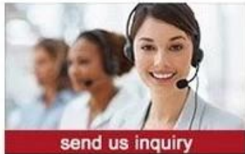
send us inquiry