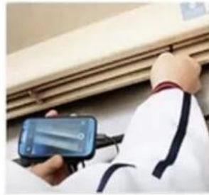
AIR CONDITIONER INSPECTION