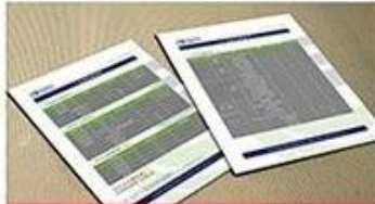
receive our quotation