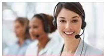
send us inquiry