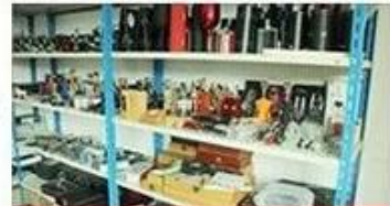
confirm the sample