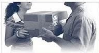
balance / delivery