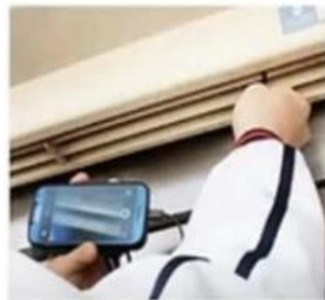
AIR CONDITIONER INSPECTION