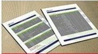
receive our quotation