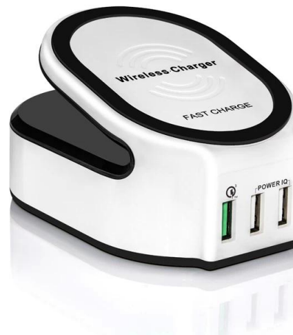
Wireless Charger Support brand: Samsung, Nokia, HTC, Google, LG, Sony, Moto