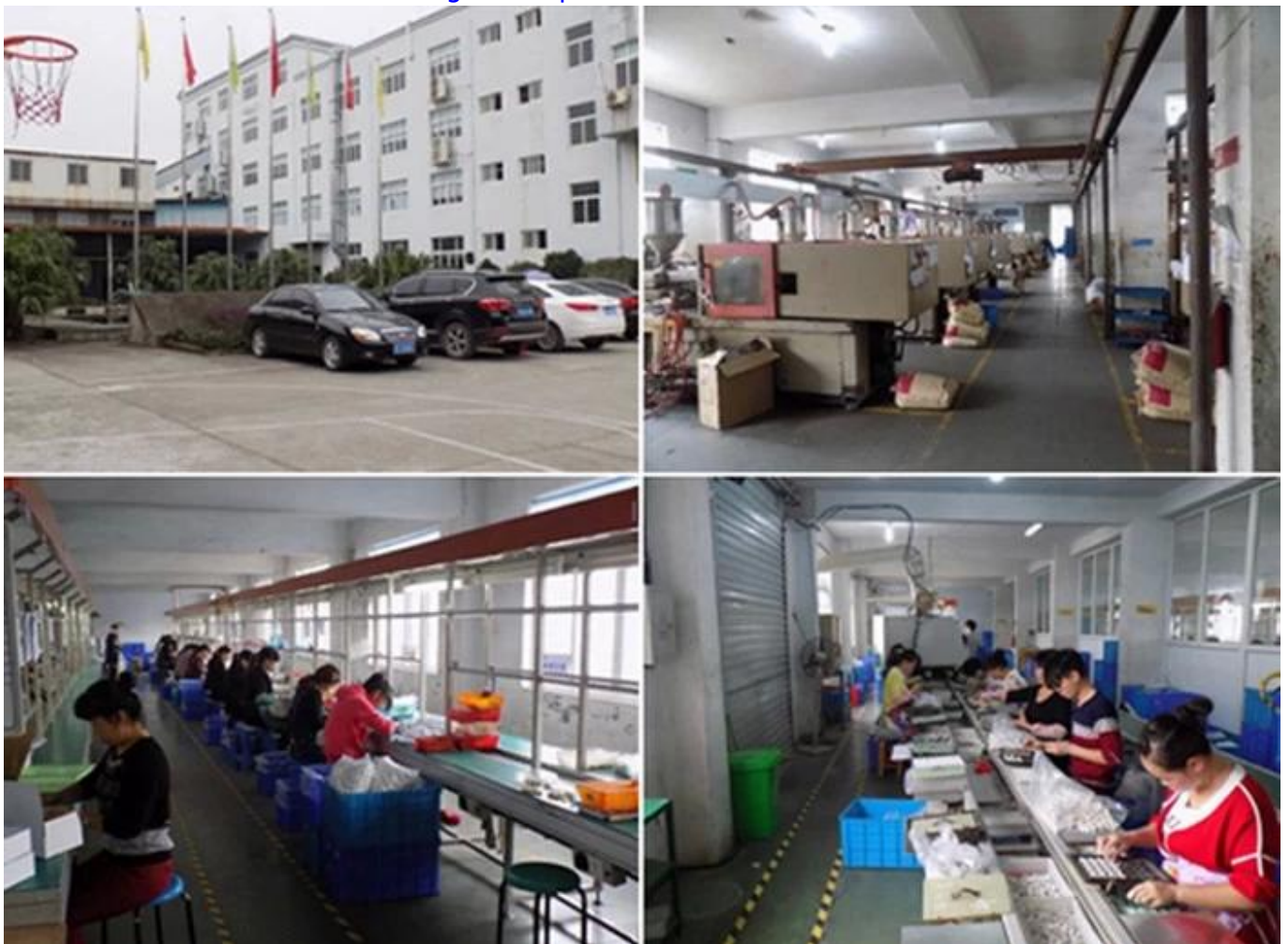
Usine de chargeur de prise murale USB