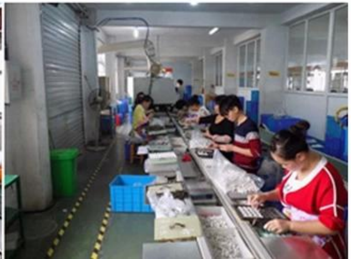
Fabbrica della Cina Caricatore presa a muro USB