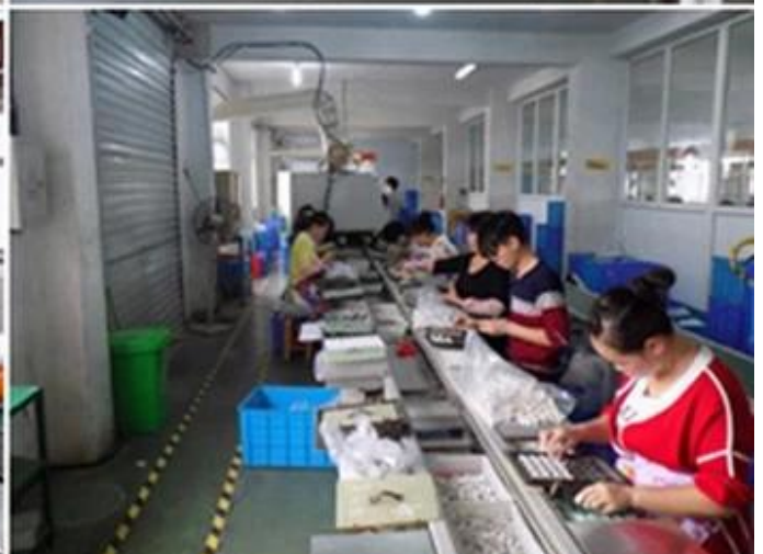
Fabbrica di caricabatterie con presa a muro USB