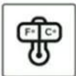
Dual temperature mode