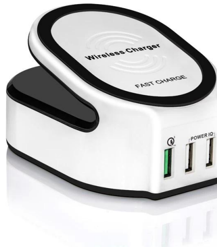
Wireless Charger Support brand: Samsung, Nokia, HTC, Google, LG, Sony, Moto