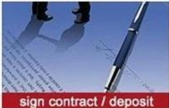
sign contract / deposit