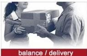
balance / delivery