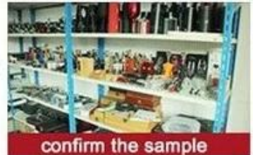
confirm the sample