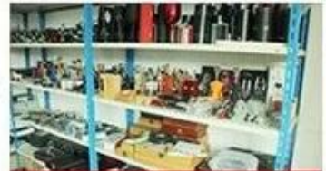
confirm the sample