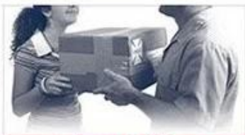
balance / delivery