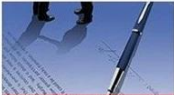
sign contract / deposit