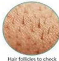
Hair follicles to check