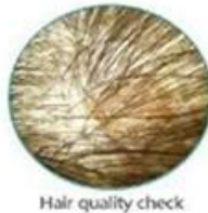
Hair quality check