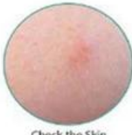
Check the Skin