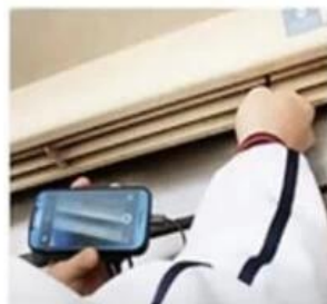
AIR CONDITIONER INSPECTION