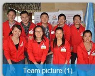
Team picture (1)