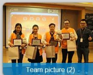
Team picture (2)