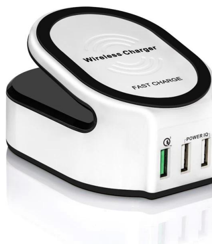
Wireless Charger Support brand: Samsung, Nokia, HTC, Google, LG, Sony, Moto