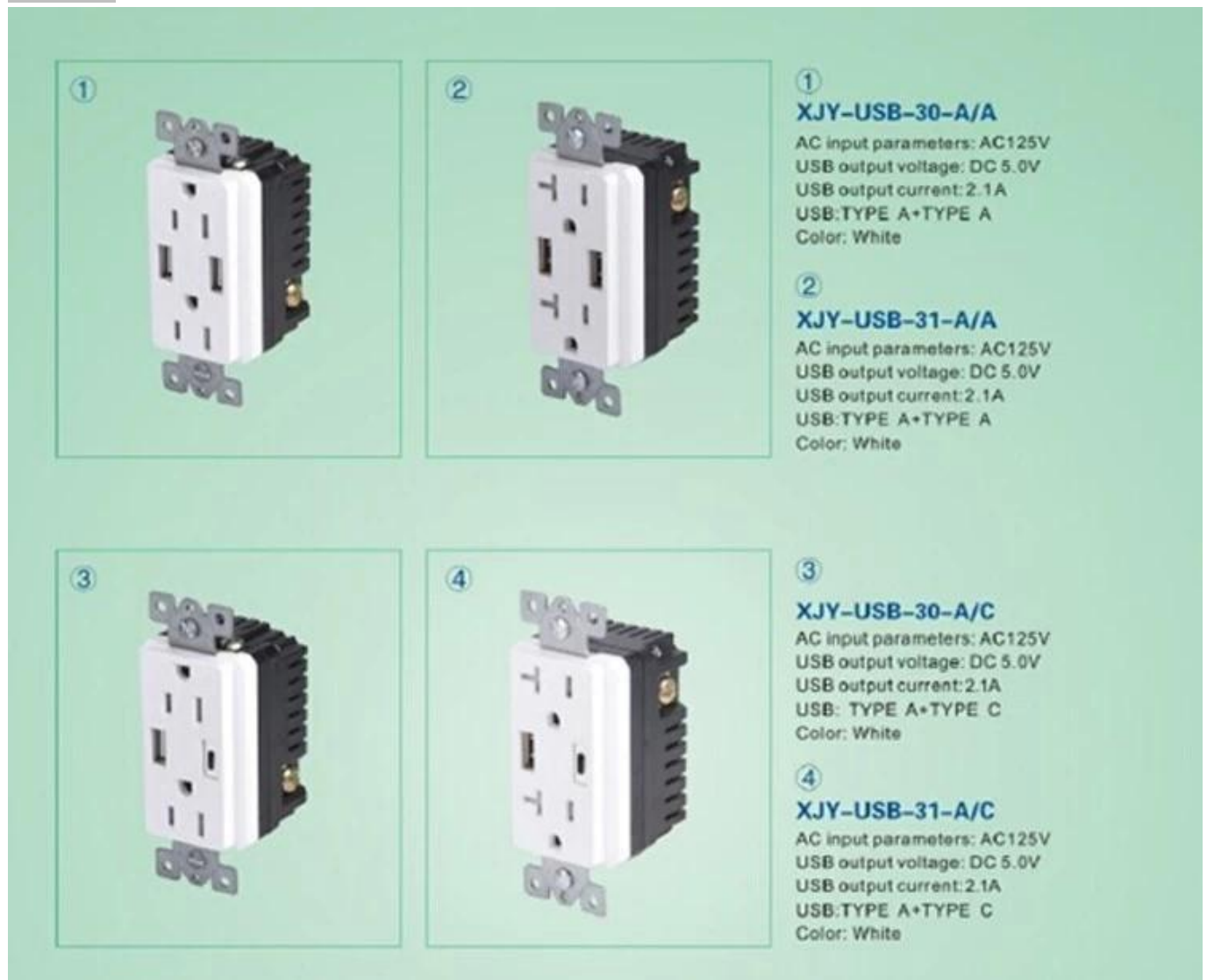
USB зарядное устройство с поставщиком