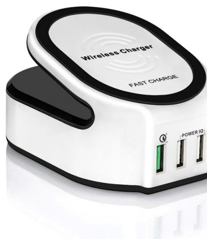
Wireless Charger Support brand: Samsung, Nokia, HTC, Google, LG, Sony, Moto